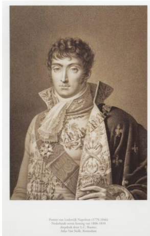
Lodewijk Napoleon Koning van Holland