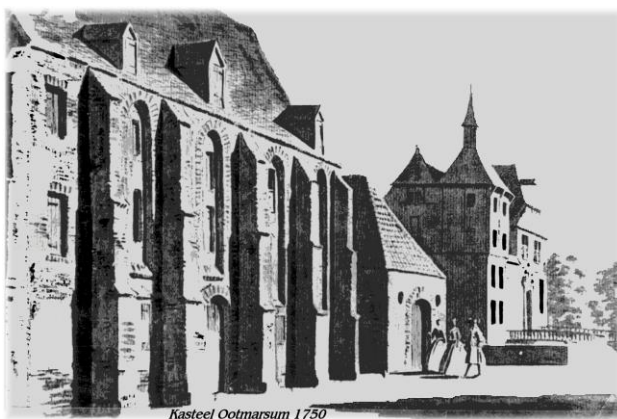
Kasteel Ootmarsum 1750

Het bezoek aan Ootmarsum werd goed voorbereid en er vond correspondentie plaats over de te bespreken punten, over hoe groot het gezelschap was dat Ootmarsum zou aandoen en het programma. Op de reis in 1809 werd in verschillende plaatsen de kerken teruggegeven aan de rooms-katholieken. Dit gebeurde in Oldenzaal, Tubbergen, Haaksbergen en Ootmarsum. De koning had besloten om 1 nacht in Ootmarsum te verblijven en voor hem was het Huis Ootmarsum, de voormalige Commanderie als nachtverblijf uitgekozen.